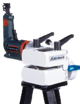
Biegeboy mit Werkstattständer

zum Strecken von aufgekanteten Scharen bis 0,8 mm Blechstärke, Regulierbare Geschwindigkeit, mit Vor- und Rücklauf. max. Aufkanthöhe 50 mm.